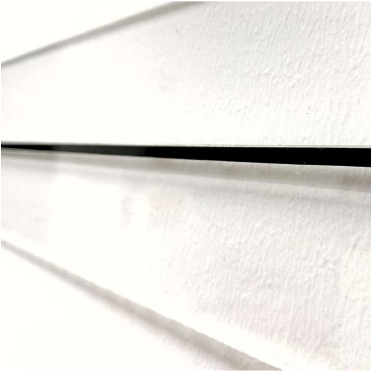
remind/rewind , 2026, Detailansicht der Installation

remind/rewind ist eine Klangskulptur, die zur Erkundung magnetischer Tonträger einlädt. Die aufgespielten Klänge können mittels eines mobilen Lesekopfs und Kopfhörern manuell abgetastet werden. Durch konstantes Verschieben des Lesekopfs wird die auf dem Tonband enthaltene Information hörbar.