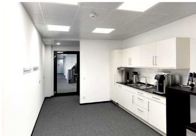
Installation in der Klaus Faber AG