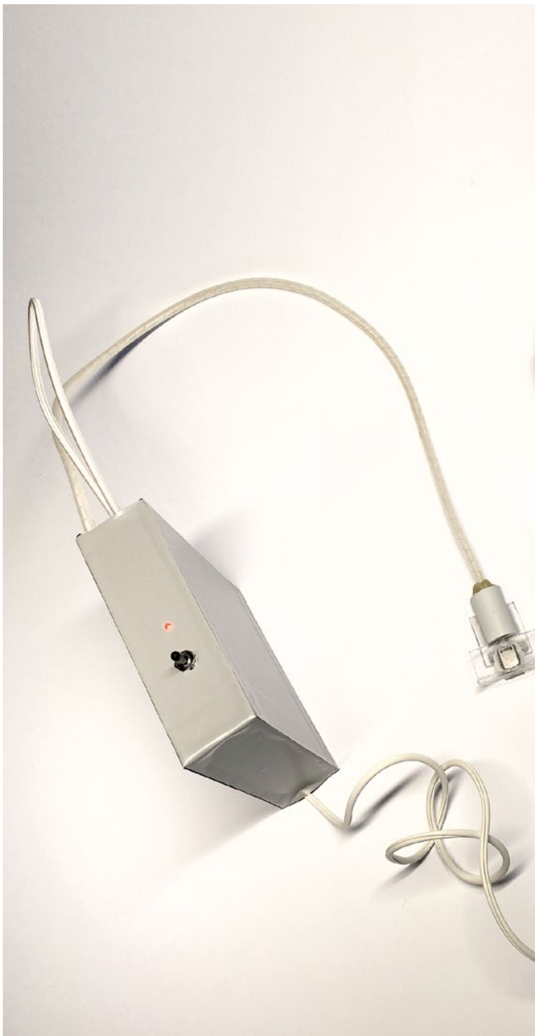
remind/rewind , 2026, Bestandteile der Installation: Tonabnehmer, Kopfhörer