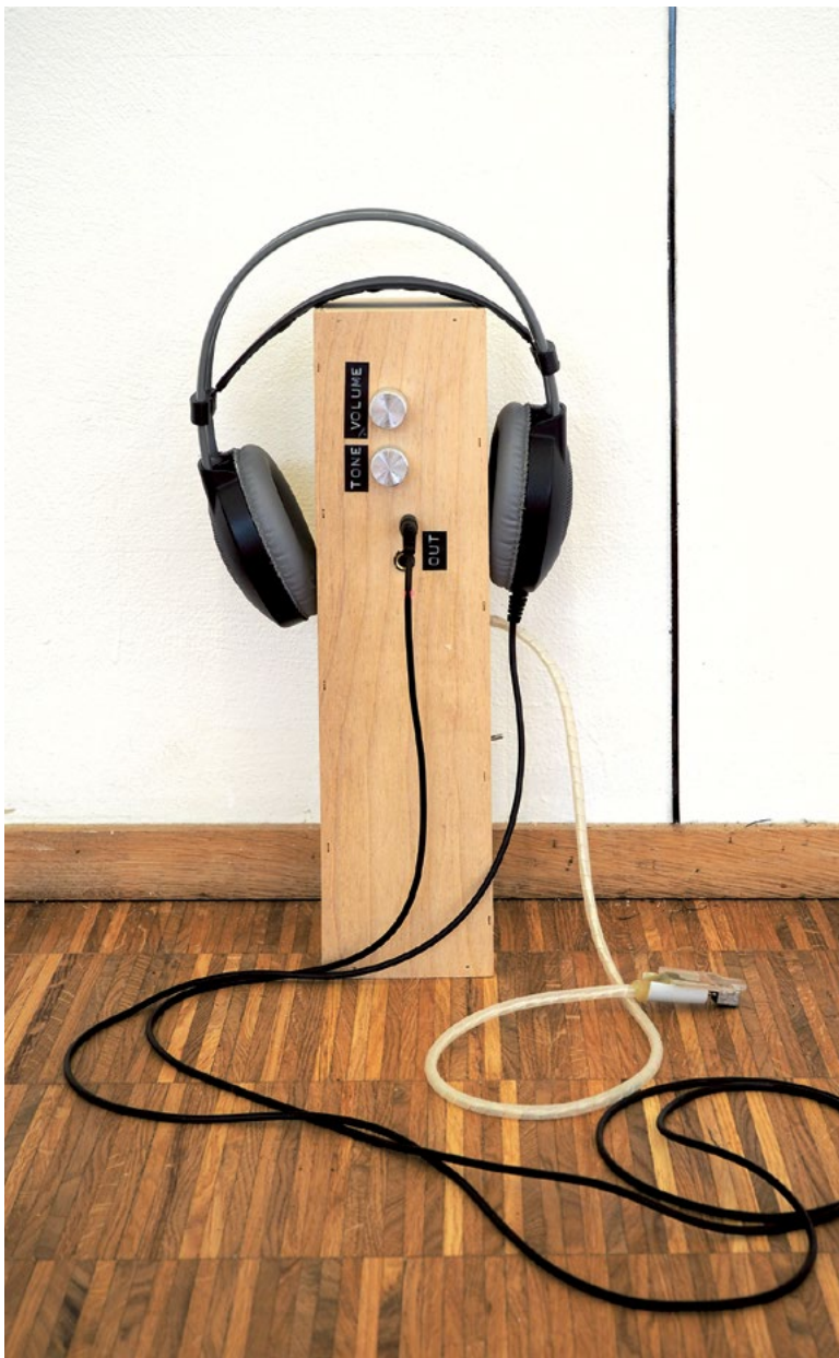
remind/rewind, 2026, Detailansicht